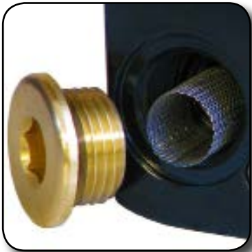
Crépine de protection