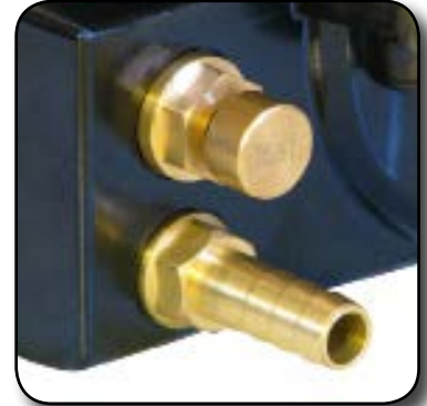
Bouton de test