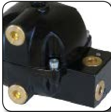
3 raccords d'entrée